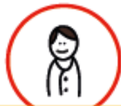
OFFICIER VAN JUSTITIE

Het dreigende ernstige nadeel moet voortkomen uit (het vermoeden van) een psychische stoornis.